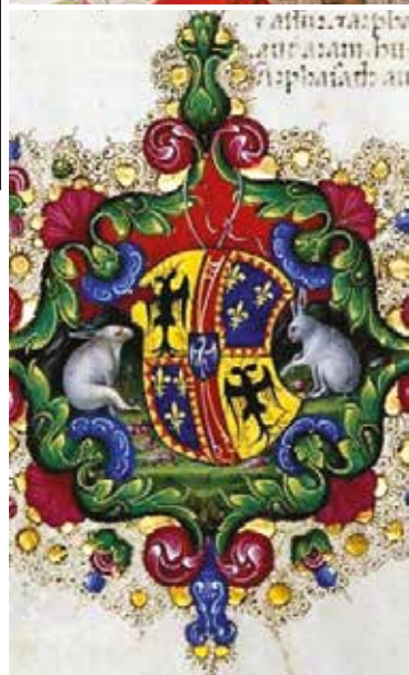
Particolari della Bibbia di Borso d'Este, 1455-1461 (Biblioteca Estense Universitaria).