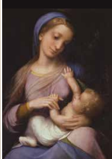
Madonna col Bambino di Antonio Allegri, detto Il Correggio, 1517-1518 (Galleria Estense).