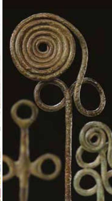
Spilloni in bronzo dalle terramare, 1550-1250 a.C. (Museo Civico).

Nata come libreria privata della Casata d'Este, ebbe illustri bibliotecari come il Muratori e il Tiraboschi. Nel 1764 il duca Francesco III la aprì al pubblico. Conserva miniature, manoscritti, carte geografiche, incunaboli, codici miniati, tra cui: la Bibbia di Borso d'Este (1455-1461). Con l'Unità d'Italia venne accorpata alla Biblioteca Universitaria, costituendo la "Biblioteca Estense Universitaria". Trasferita nel 1882 nel Palazzo dei Musei, dal 2016 fa parte delle "Gallerie Estensi".