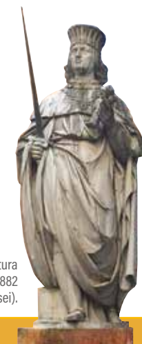
Borso d'Este, scultura di Ferdinando Pellliccia, 1882 (Cortile del Palazzo dei Musei).

La biblioteca, istituita nel 1872 grazie al lascito dell'architetto Luigi Poletti, è specializzata in architettura e discipline artistiche e conserva anche un ricco patrimonio antico (XVI-XIX sec.) di volumi, stampe, disegni, fotografie, carte geografiche, oltre ad archivi di arte e architettura e un'importante raccolta di libri d'artista.