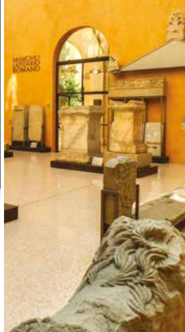
Lapidario Romano del Museo Civico.