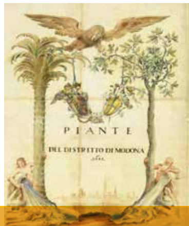
Piante del Distretto di Modena di Giovan Battista Boccabadati, 1687 (Archivio Storico).

Depositario e custode degli atti prodotti dalla Comunità nel corso dei secoli, è un punto di riferimento per chi voglia avvicinarsi alla Storia e alla cultura della città e del suo territorio. Organizza seminari, mostre temporanee e laboratori didattici.