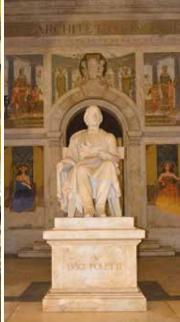
Scultura raffigurante Luigi Poletti di Carlo Baraldi, 1904 (Biblioteca Poletti).

È il primo museo pubblico istituito a Modena nel 1838 grazie al duca Francesco IV d'Austria-Este, per glorificare il passato illustre della città fin dalle sue origini come colonia romana di Mutina . Oltre ai reperti di età romana, espone memorie e arche sepolcrali.