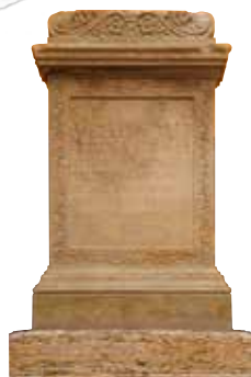
Particolare dell'Ara di Vetilia Egloge, I sec. d.C. (Lapidario Romano del Museo Civico).