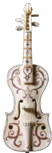
Violino in marmo di Giovan Battista Cassarini, 1687 (Galleria Estense). A sinistra, una delle sale della Galleria Estense.

La Galleria Estense espone disegni, bronzi, ceramiche, strumenti musicali e medaglie provenienti dalla Casata d'Este. Sono presenti dipinti dal XIV al XVIII secolo, tra cui opere del quattrocento modenese, di scuola fiamminga, di Correggio e Velazquez. Tra le sculture: il busto di Francesco I d'Este, capolavoro di Gian Lorenzo Bernini e diverse opere di Antonio Begarelli.