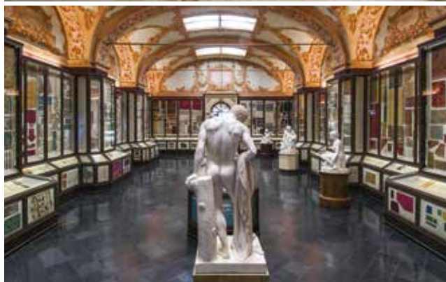
Monumenti sepolcrali (Museo Lapidario Estense).