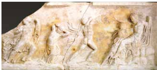
Lastra dei Niobidi, I sec. d.C. e Sala Gandini (Museo Civico).